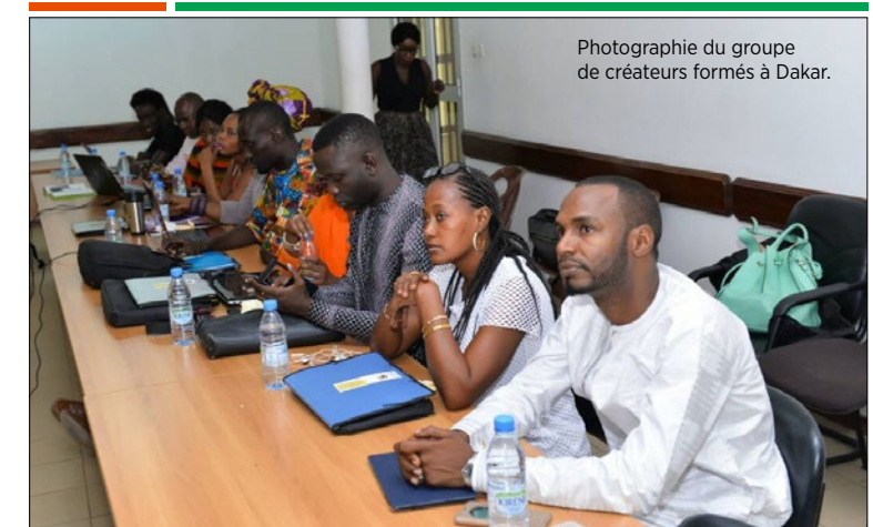
Photographie du groupe de créateurs formés à Dakar.

Où l'on voit qu'un programme pensé pour les créateurs et les stylistes d'Afrique francophone pourrait faire des émules dans d'autres secteurs et d'autres endroits du monde, dès lors que l'on veut faire rimer travail du français et professionnalisation. ■